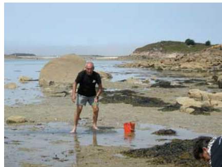
on ausculte le terrain,