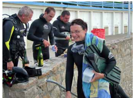
Les premiers ont déjà sorti le réconfort.