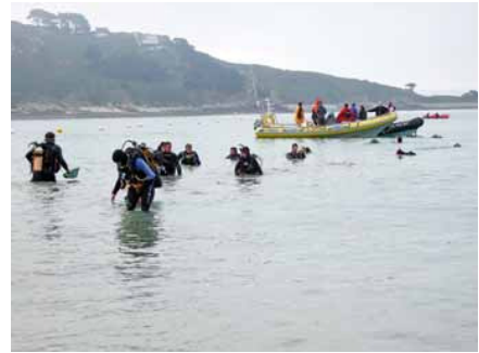
C'est parti pour l'échauffement.