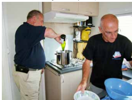
le vin blanc,