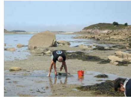
on creuse à nouveau,