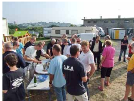
Ensuite on déguste et on fête comme il se doit ce magnifique succès.