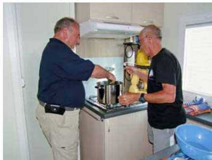
on ajoute le persil,