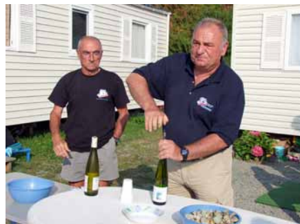
Grande maitrise du bras et de la main droite...