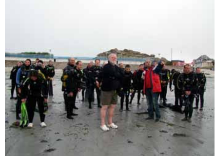
Tout le monde se regroupe pour écouter les dernières consignes.