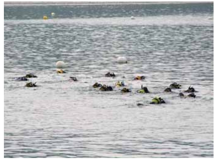
C'est parti pour 1000m sur une mer parfaitement plate.