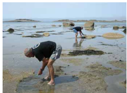
attentifs et persévérants...