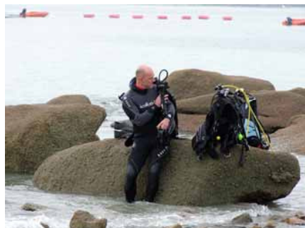
on se prépare pour le 1000m capelé.