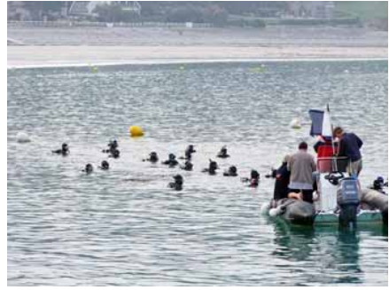
Tout le monde se regroupe sur la ligne de départ.