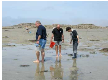
Un diplôme de pêcheur de palourde est à la clef...