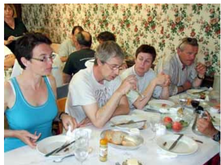
avant les festivités de ce soir on se repose