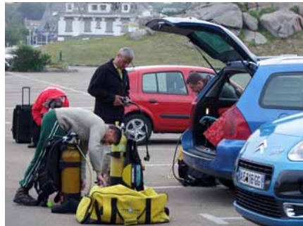
Dernière épreuve physique, souvent redoutée,