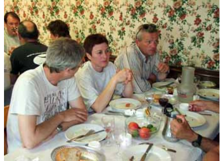
12h30, à "L'écume de mer" tout le monde est à l'heure,