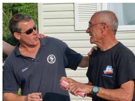
Félicitations aux nouveaux impétrants.