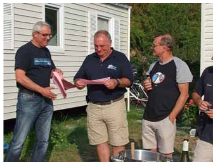
C'est gagné... ils sont reçus.