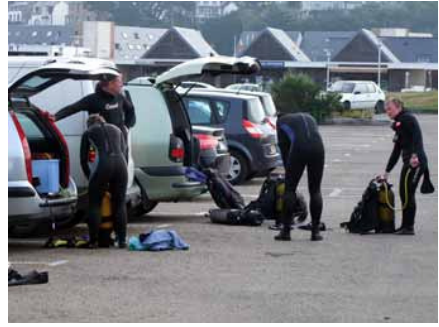
Retour aux voitures, on plie bagage... Pour un groupe il reste une épreuve de pédagogie et ce soir c'est la fête.