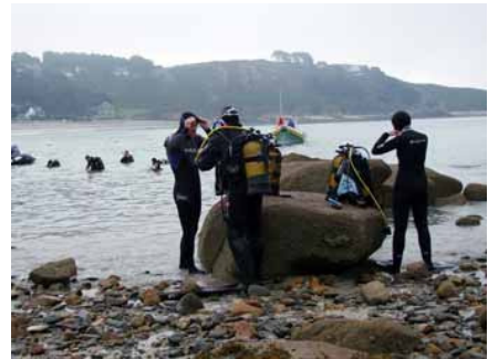
Tout le monde à l'eau...