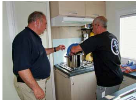
Après l'eau de mer