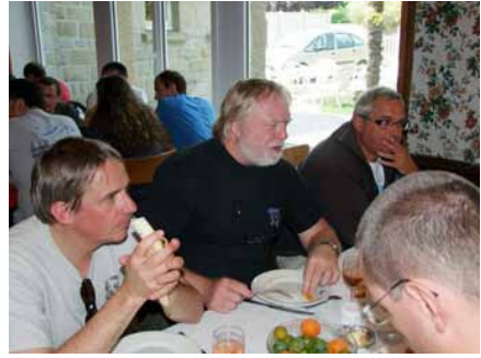
et on apprécie d'avoir terminé ce MF2.