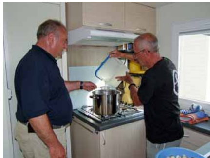
Seconde préparation, les "rigadeaux".